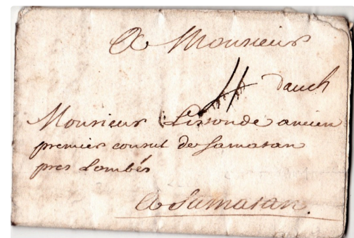
Lettre datée 1740.