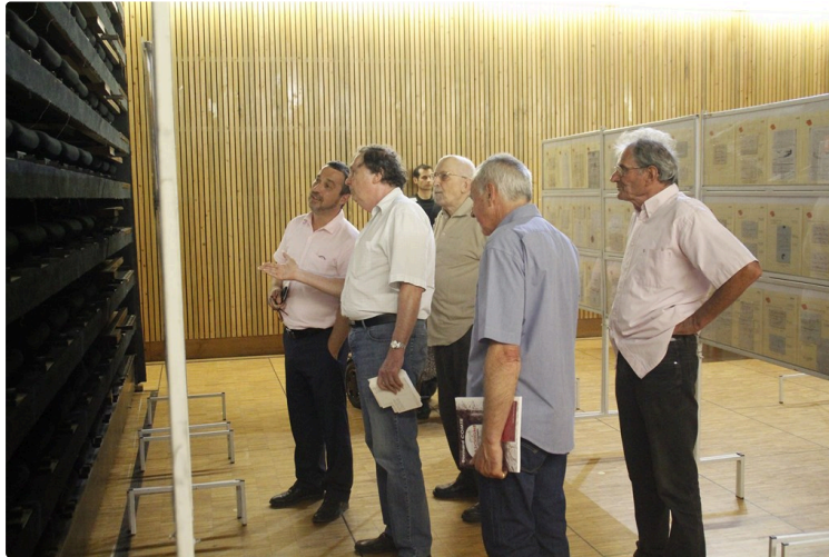
Inauguration de l'exposition philatélique.

3000 lettres retracent 350 ans d'histoire postale d'Auch.