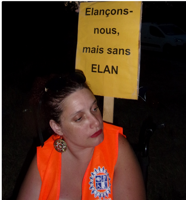
EXCLUSIF ! Nouvelle action du Handi-Social

Deuxième soir de blocage pour le convoi de l'A380