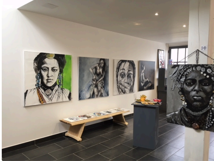
Une exposition multiculturelle à quelques pas du Gers

Photo : Les oeuvres de Frédérique Nadia Gros