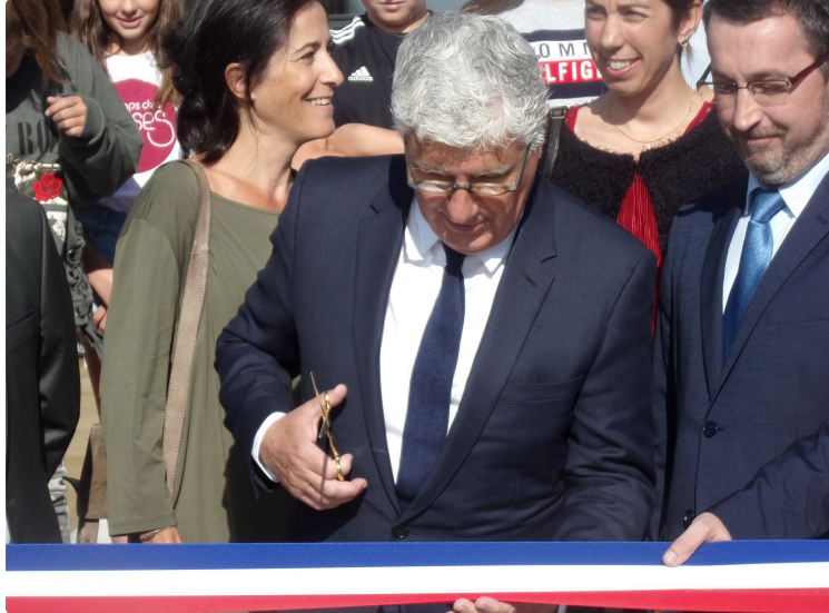
inauguration du 22ème collège du Gers