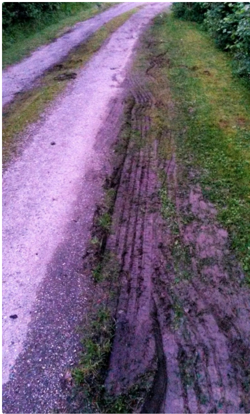
Et les dégâts qui vont avec...