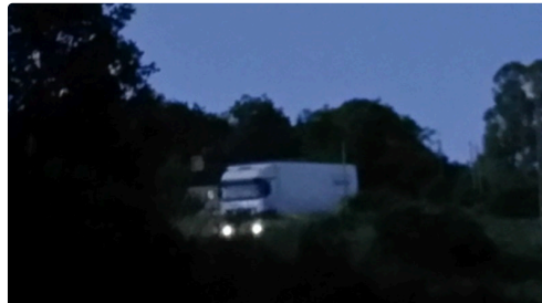
comme de nuit