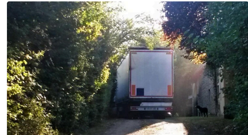
Pris au piège !