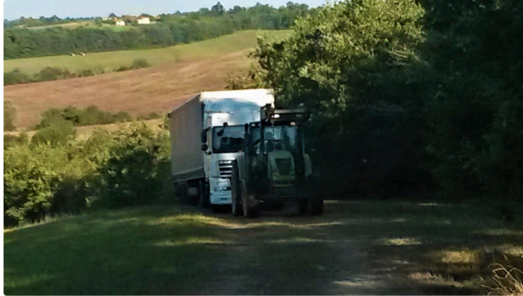
Non, Saint-Pierre n'est pas Saint-Mont !

C'est un phénomène récurrent depuis plus d'un an pour ces résidents d'un petit chemin de la commune de Saint-Pierre d'Aubézies.