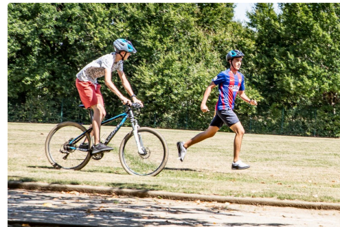
Course à 2 (à VTT et à pied avec