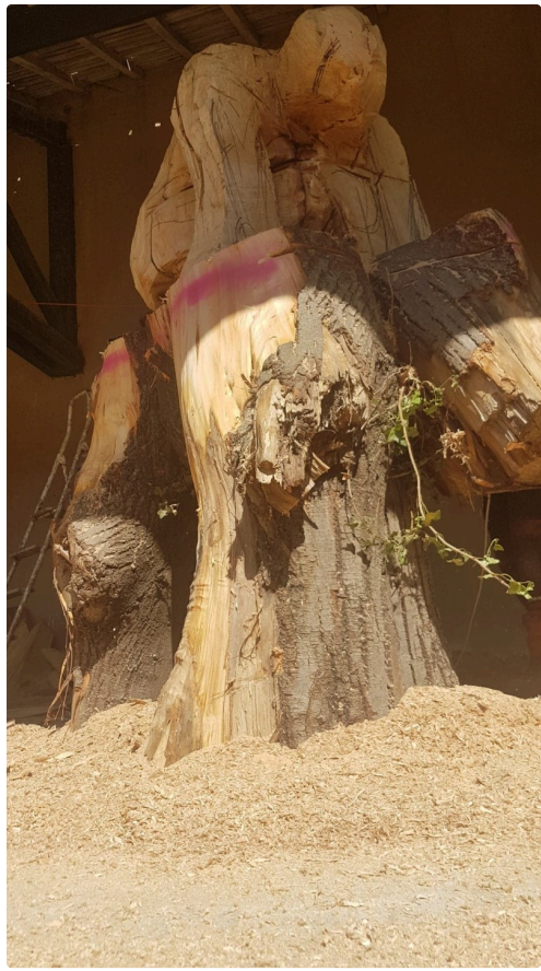
Sculpture Trogne_Phil Meyer.jpg