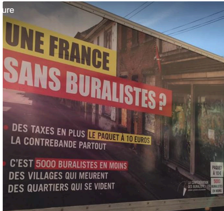
Buralistes en colère

Ils voulaient attirer l'attention sur leur situation opération réussie