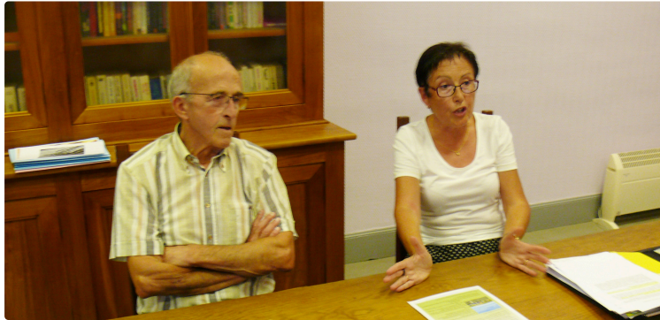
La Maison de la culture fête ses dix ans

Durant tout ce week-end se dérouleront de nombreuses animations