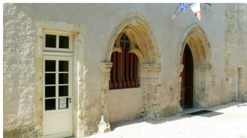
Entrée de la maison de la culture.