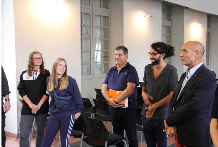
Des jeunes volontaires venus du monde entier

Ils réalisent un chantier pour la sous-préfecture condomoise