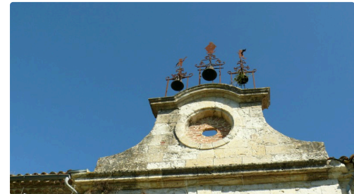
L'horloge était surmontée de trois petites cloches sur un support de ferronnerie, ornées de silhouettes en métal découpé représentant la Vierge entourée de deux anges sonnant de la trompe.