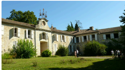
Vue des bâtiments.