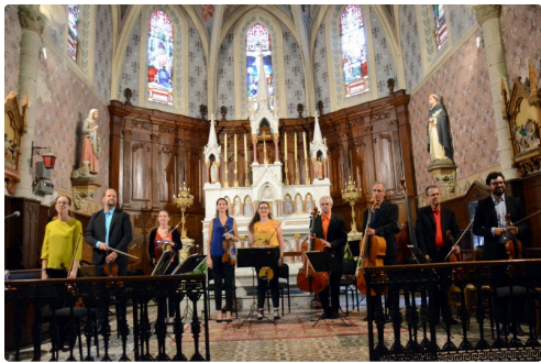
Sarrant 0457 (1).JPG