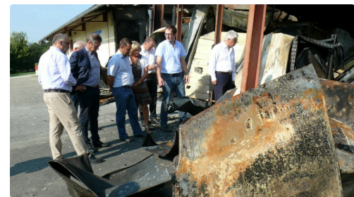
Découverte au plus près des dégâts.