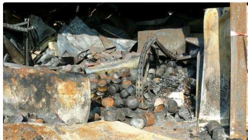
Les conserves calcinées.