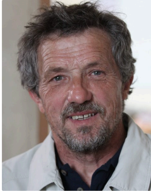
La galerie l'Arcade clôture la saison avec le peintre auscitain Patrick Rabassa