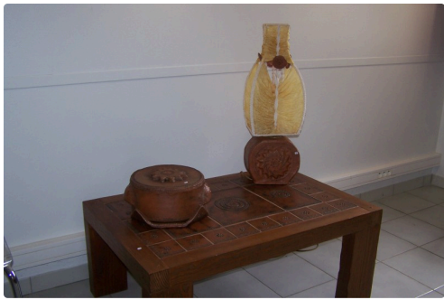
Table en céramique, cloche à fromages, et lampe