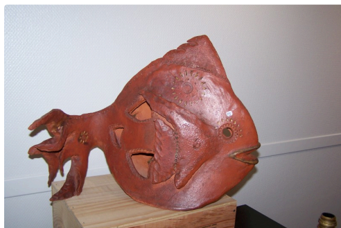
Un petit air de "Nemo" peut-être ?

Horaires : tous les jours du lundi au samedi de 9 h 30 à 12 h 30 et de 14 h à 17 h 30