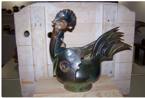
Le chant du coq