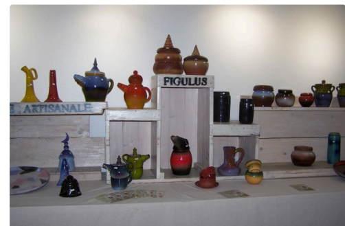
Arts de la table