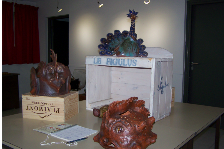
Exposition à l'Office de tourisme de la Gascogne Toulousaine : Les potiers Nicolas et Hervé Guegan exposent leurs étonnantes pièces...