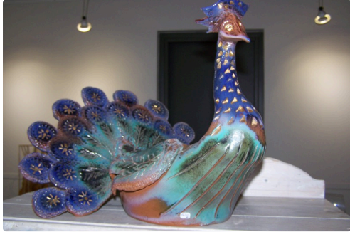
le figulus poterie ot l'isle jourdain et comme une envie touget 009.JPG