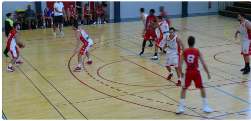
Phase de jeu.