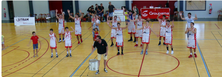
Championnat de France Basket NM3 : Auch seul leader

Les Auscitains s'imposent face au stade Clermontois au cours d'une seconde mi-temps aboutie