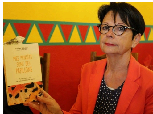
La MVCC s'engage auprès de France Alzheimer Gers