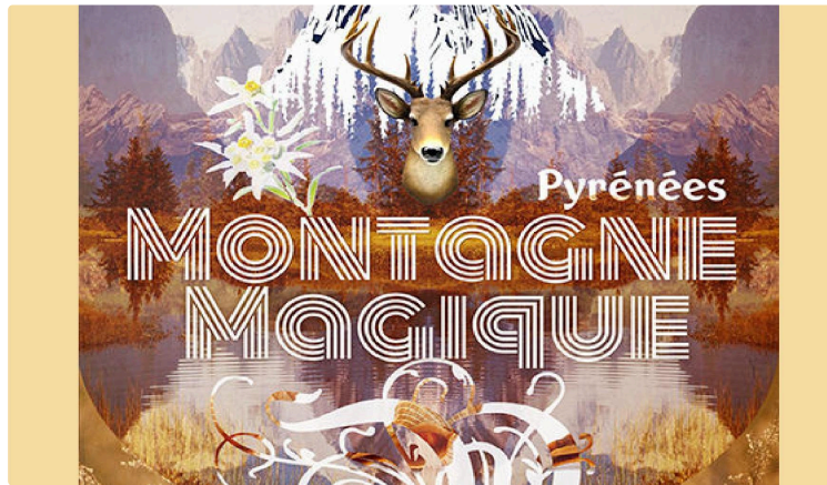
Un voyage au cœur de la magie grandiose des Pyrénées

Il s'agit d'un photo-concert où la magie des images et de la musique jouée en direct évoqueront les Pyrénées magiques