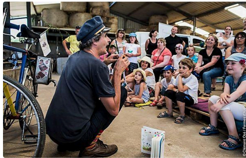
Capture d'écran (150).jpg