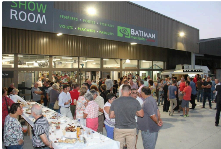
Sommabere une entreprise du pays

L'entreprise familiale fidèle à ses racines