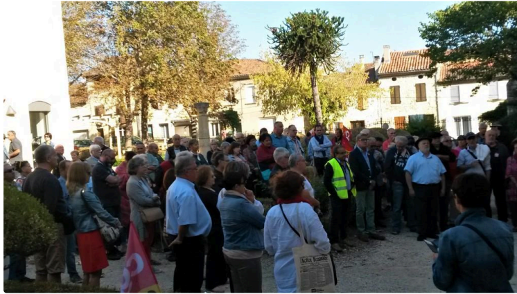
Inauguration de l'union locale C.G.T.

Ce samedi matin, le parc de l'ancien hôpital connaissait une importante animation. La CGT inaugurait son nouveau local et Philippe Martinez, secrétaire général de la CGT, était invité à couper le ruban.