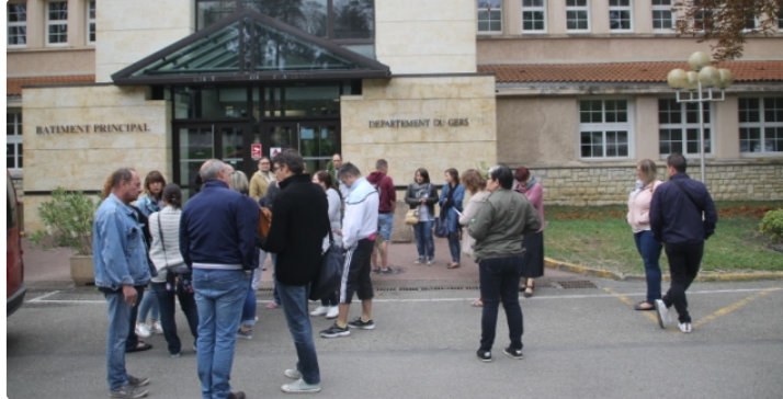
Les grévistes du CHS à la rencontre des élus départementaux

Lundi 1er octobre, devant la tente installée à l'entrée du CHS d'Auch, les grévistes se sont réunis pour un départ en manif vers le conseil départemental à la rencontre des élus départementaux pour qu'ils assument leurs responsabilités de collectivité territoriale de référence.