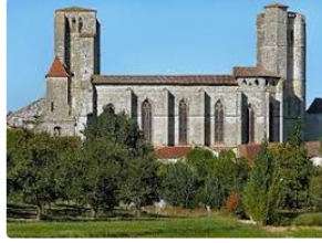
Archéologie, Architecture,et musique.