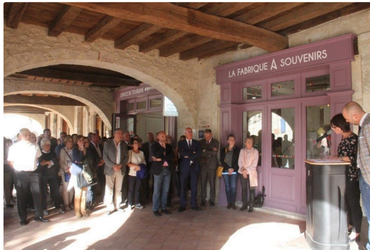
Le Bureau d'Informations Touristiques dédié à l'oenotourisme inauguré

Mercredi 10 octobre, le Bureau d'Informations Touristiques de Montréal du Gers, dédié à l'oenotourisme, labellisé Vignobles et Découvertes a été inauguré en présence de nombreuses personnalités.