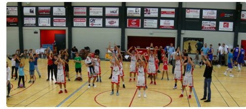
Le traditionnel clapping après la victoire.