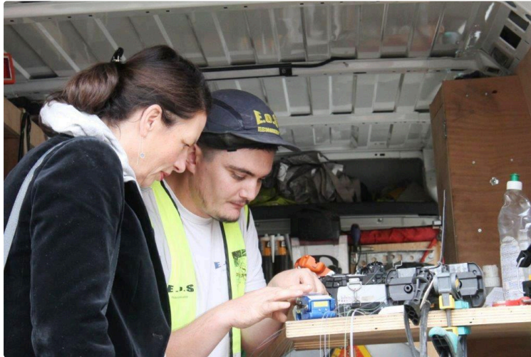
Gers Numérique tisse sa toile en Ténarèze

Valence-sur-Baïse et Mignaut-Tauzia pourront se brancher sur la fibre fin novembre