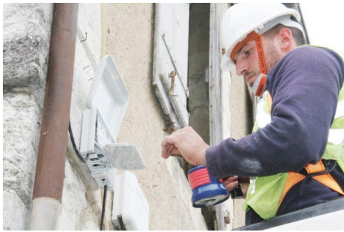
Le branchement est presque terminé.