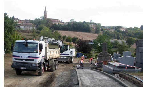
montferran saves cimetiére 2.jpg