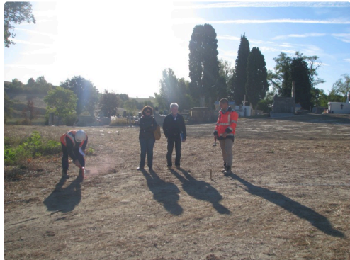
montferrant saves cimetiére4.jpg