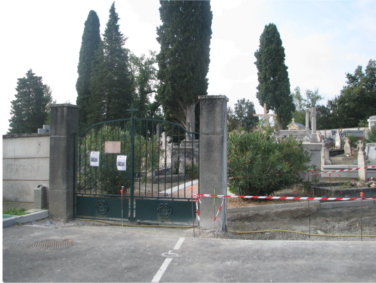
Les travaux au cimetière continuent

Après les travaux de réfection des allées, de création d'un jardin du souvenir et d'un columbarium, en 2016, la mairie a réalisé à l'automne 2018 une extension du cimetière sur sa partie « ouest. » La clôture doit être posée avant Toussaint.