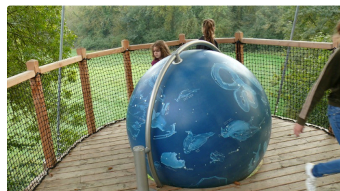
La sphère de la biodiversité.