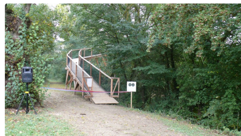
La rampe d'accès à l'oeuvre.