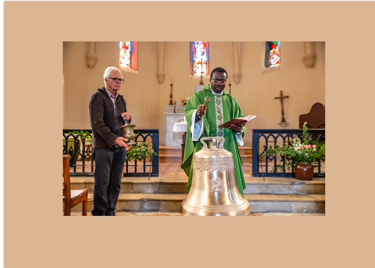
Bénédition de la nouvelle cloche de Bouzon-Gellenave

Sera-t-elle électrifiée pour le 11 novembre ?