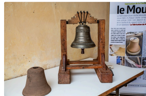
Exemples de moule et de cloche présentés par l'entreprise Laumailié