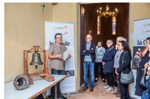
Explications de l'entreprise Laumailé