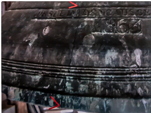
La fêlure de l'ancienne cloche