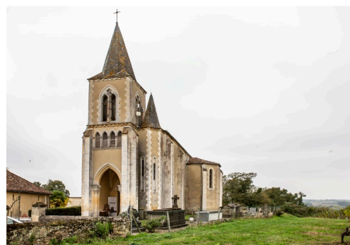
Église de Saint-Gô

(1) https://www.lejournaldugers.fr/article/29760-les-cloches-sonneront-le-11-novembre-a-bouzon-gellenave .(2) Facteur de cloches. (3) Alliage de 78 % de cuivre et de 22 % d'étain. (4) https://www.lejournaldugers.fr/article/30475-bouzon-gellenave-celebre-le-centieme-anniversaire-du-11-novembre-1918