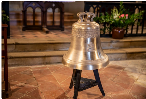
6 La cloche est prête pour la bénédiction 1bis 201018.jpg