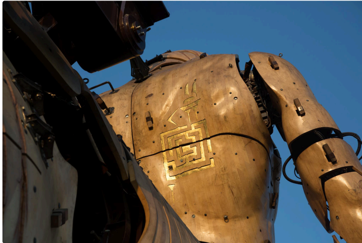
« Le Gardien du Temple » en exclusivité à Toulouse

Un Minotaure de quarante-sept tonnes va déambuler dans le centre-ville