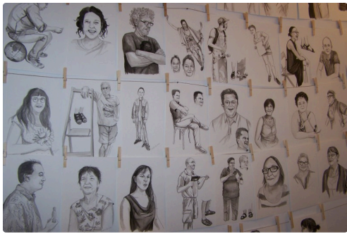
LES GENS DE LOMAGNE