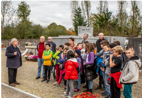
Idem ; au fond l'enseignante et les anciens combattants