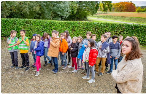
La classe de CM1-CM2 du Houga arrive au cimetière