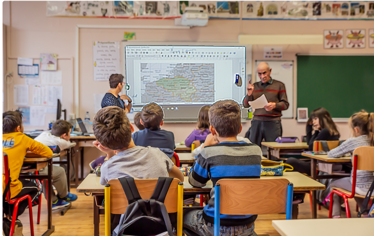
L'école du Houga prépare le 11 novembre