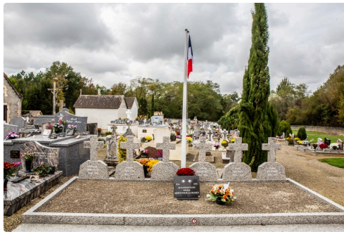
Le carré militaire