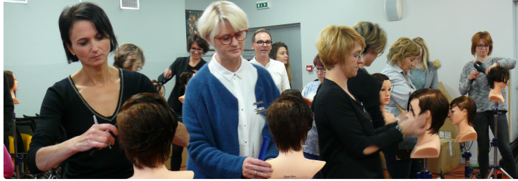
Coiffure : Passer de l'ultra féminin au super-rock ...

Les artisans coiffeurs du Gers ont travaillé sur la collection « Tentation »