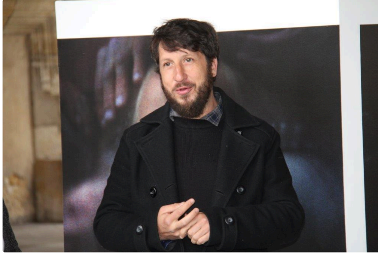
Résidence d'actions culturelles