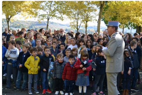
Les enfants des écoles ont participé à la cérémonie.