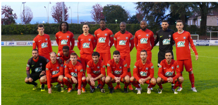
Football, 7ème tour de la Coupe de France : Auch tout en lucidité pour recevoir le Gazélec d'Ajaccio, Ligue 2

L'exploit est attendu, "Ils y croient tous", joueurs, staff, bénévoles, et tout le foot gersois