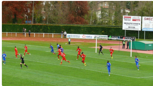
Auch repart à l'attaque.