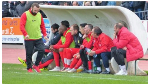
Le banc auscitain.