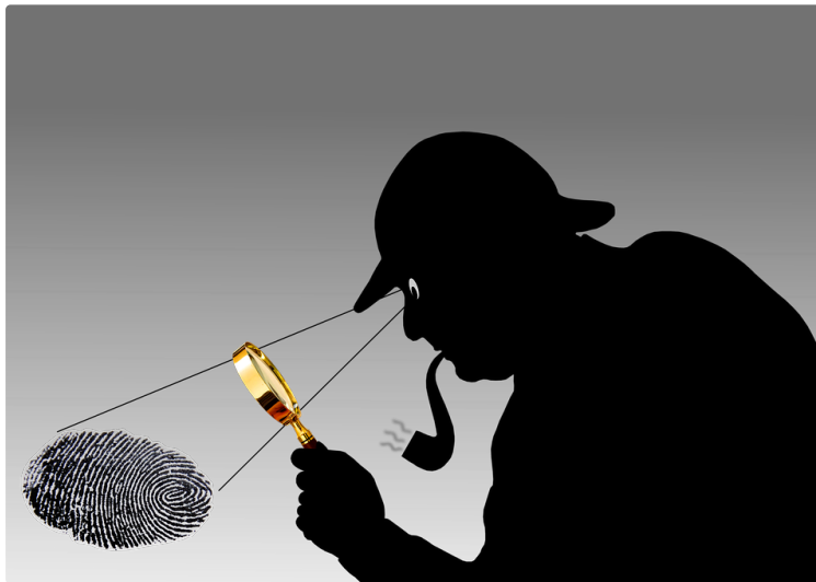
Festival du Polar d'Auch

40 auteurs de polars réunis aux Cordeliers