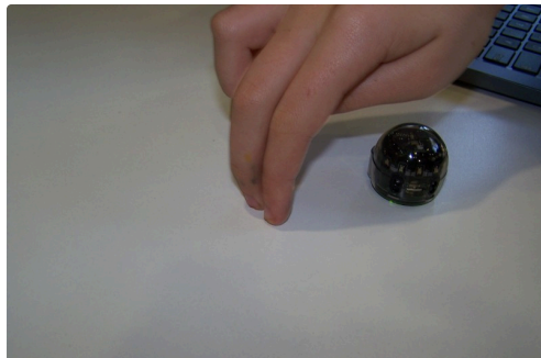
Le voilà, le petit "Ozobot"