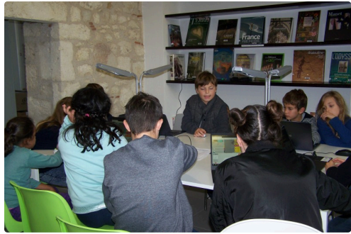
ils sont éblouis par cette nouvelle technologie