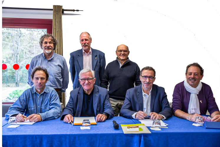
L'année bien remplie du cyclo-club de Nogaro

Nombreuses sorties malgré une météo difficile