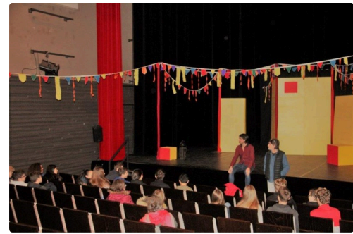
Boite à joue 3.jpg