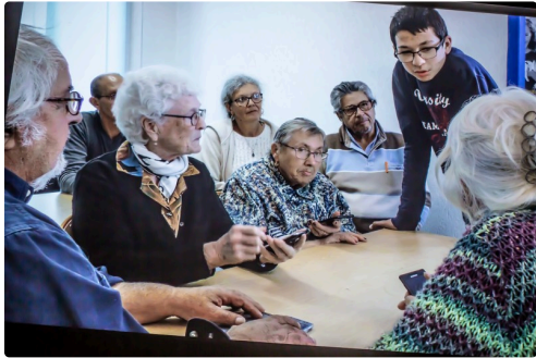
La leçon de smartphone - Vue prise pendant la projection