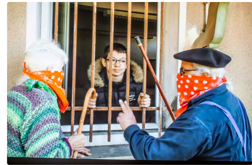
Interrogatoire de l'adolescent kidnappé - Vue prise pendant la projection