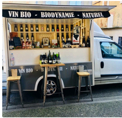
La Caisse à vin sur les marchés gersois