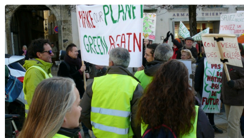
Rencontre place de la Libération entre Gilets jaunes et marcheurs pour le climat.

Alors que certains retournaient au rond-point des Justes pour se retrouver autour des barbecues, d'autres quittaient le lieu pour aller ici et là « au feeling comme le dit un Gilet jaune » vers les ronds-points et en ville. Une technique de manifestation pacifique qui, sans bruit, s'avère efficace pour créer des ralentissements.