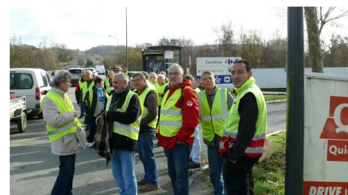
Blocage de l'entrée du centre commercial Carrefour.