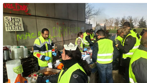
intendance assurée