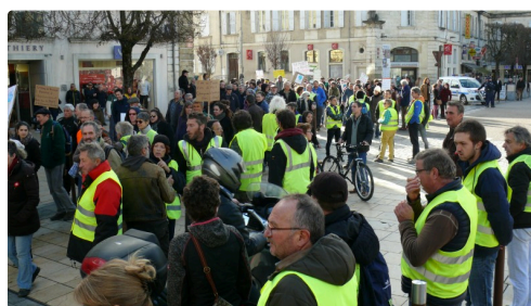
Gilets Jaunes et marcheurs pour le climat sur la place de la Libération.