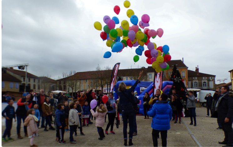
Joli succès du téléthon

Le Téléthon organisé place de l'Hôtel de Ville a connu cette année encore un joli succès.