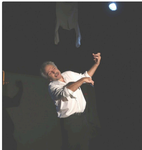
Robert Group bis.jpg