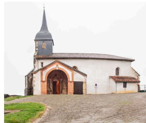
Vue de l'église de Luppé