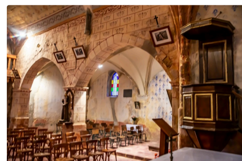
Les voûtes du mur central de l'église de Luppé