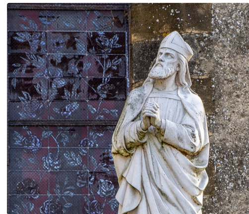
Statue de Saint Austinde à côté de l'église de Nogaro