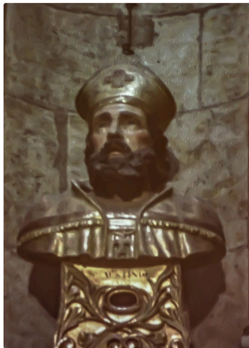
Buste reliquaire de Saint Austinde à la cathédrale d'Auch - Photo projetée par Marie-Françoise Migeot