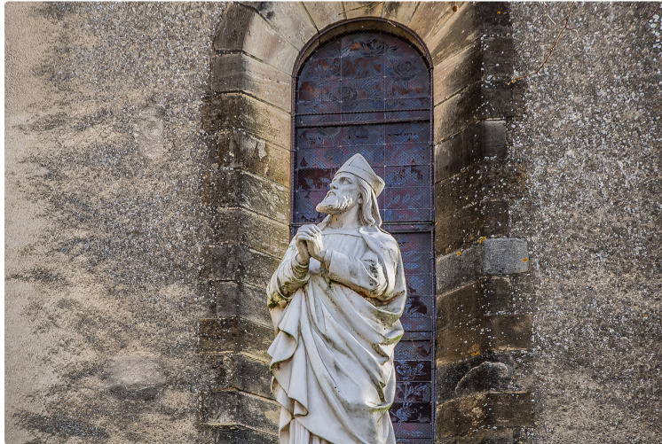
Saint Austinde sous les projecteurs à Nogaro

Pour le 950ème anniversaire du fondateur de la ville