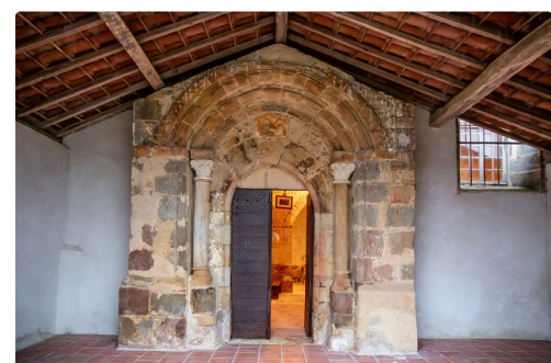
Portail de l'église de Luppé