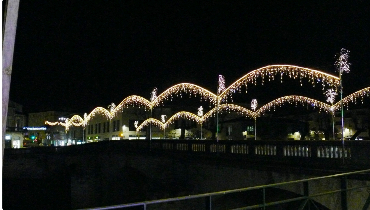
La ville brille de mille feux

Depuis le 1er décembre, les illuminations de Noël brillent sur la ville de mille feux, un spectacle à apprécier à la tombée de la nuit qui se prolongera jusqu'au 4 janvier. Une véritable prouesse réalisée par le service municipal « Fêtes et cérémonies » qui a installé 8,5 km de guirlandes illuminées toutes équipées de matériel LED. A voir l'illumination tout en sobriété du parvis de la cathédrale avec son immense sapin, le grand chapiteau installé sur le rond-point de la place de Verdun (La Patte d'Oie), le pont de la Treille et ses arches lumineuses, l'avenue Alsace et son plafond étoilé... Et bien d'autres rues qui vous surprendront par leurs « travers de rue » de 8 mètres comme l'avenue Hoche ou encore la rue Rouget de Lisle. Des féeries à consommer sans modération.