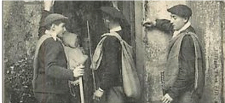
Los Aguilhoners, une tradition de l'Avent qui s'est perdue

Lors de sa création, il y a maintenant plus de dix ans, l'Académie de Gascon s'est donnée comme objectif de transmettre la langue mais aussi de porter à la connaissance des jeunes générations ce qu'étaient nos traditions à chacun des moments importants de l'année.