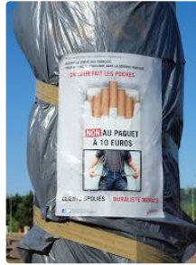
Vers la fin des radars fixes ?

De tous temps, quelques réfractaires à la limitation de vitesse ont rendu inopérants des radars fixes. Quelques manifestations - elles sont assez nombreuses et variées en France - se sont traduites aussi par des mises hors service avec ou sans dommages pour les appareils : bâchés, déguisés, recouverts de peinture, saccagés, incendiés. Le mouvement a pris une ampleur considérable avec les manifestations des Gilets Jaunes. Le fait de groupes déterminés ou de quelques quidams désœuvrés, les dommages sont plus graves et qui, cette fois encore, va payer la facture ? Le Gouvernement, c'est à dire vous et moi ! Tous ensemble ! tous ensemble !